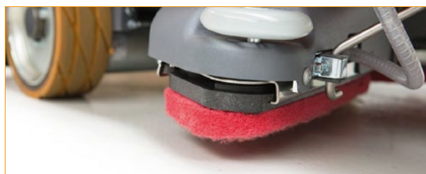
swingo XP-M - Spazzole microrotanti