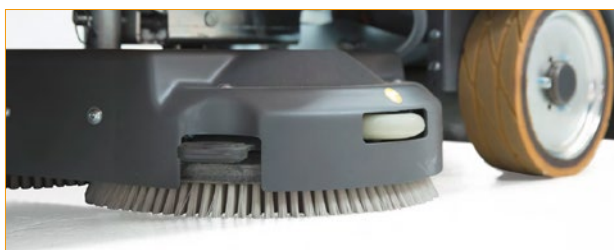
swingo XP-R - Spazzole circolari

Le spazzole circolari della swingo XP-R aderiscono e seguono perfettamente il profilo del pavimento per garantire un'eccellente rimozione dello sporco.